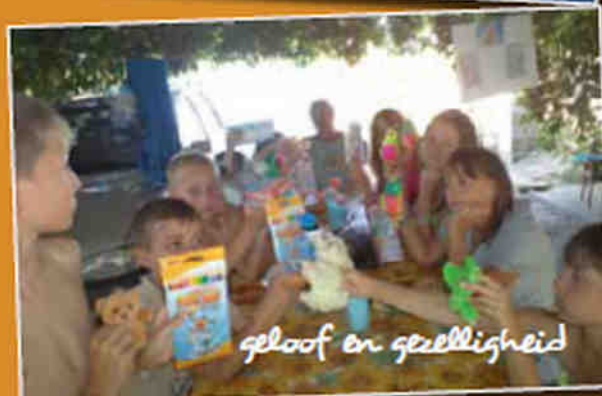
geloof en gezelligheid