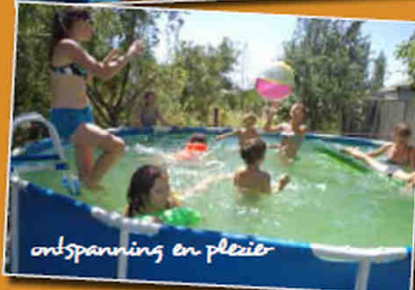
ontspanning en plezier